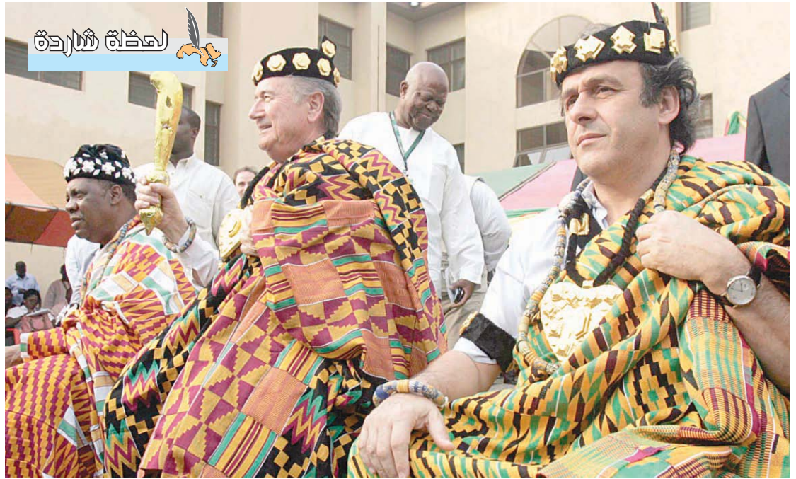
في أقصى اليسار عيسى حباتو رئيس الكونغو العالمية الأفريقية وسبب بلاتر رئيس الاتحاد الدولي وميشيل بلاتيني رئيس الاتحاد الأوروبي لكرة القدم وهم يرتدون الزي التقليدي الغاني قبل افتتاح الموندوال الأسمر أمس